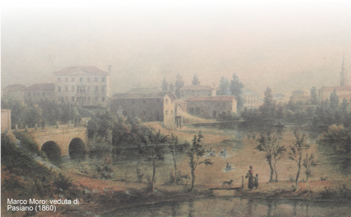
Marco Moro: veduta di Pasiano (1860)